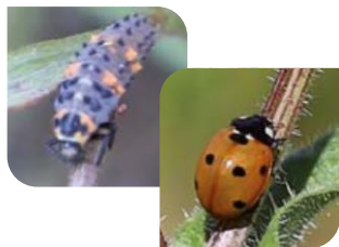
COCCINELLE (larve et adulte)

« AUXILIAIRES DE NETTOYAGE », ILS CONSOMMENT OU PARASITENT LES PUCERONS :